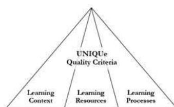
Fig. 1. Criterios del certificado UNIQUE.